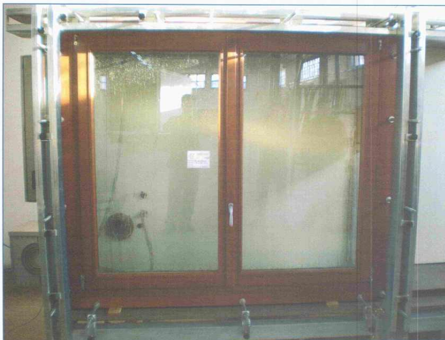
Fotografia del campione durante la prova

PERUGIA: SGM S.r.l. Sede Legale, Uffici e Laboratori certificati UNI EN ISO 9001