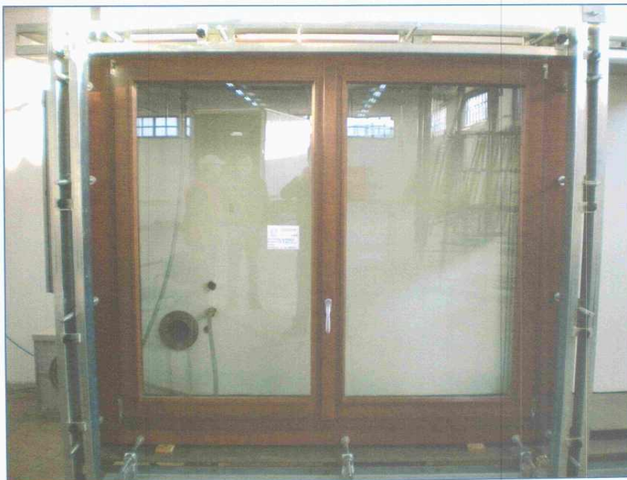
Fotografia del campione durante la prova

PERUGIA: SGM S.r.l. Sede Legale, Uffici e Laboratori certificati UNI EN ISO 9001