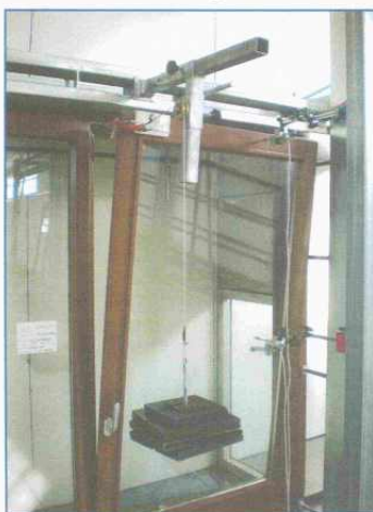
Fotografia del campione durante la prova

Eventuali danni o difetti di funzionamento: Nessun degrado funzionale riscontrato